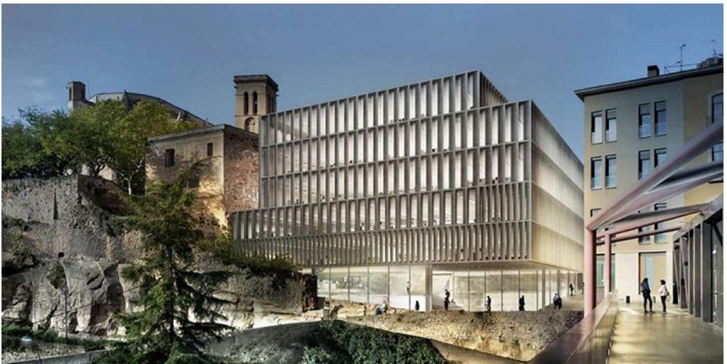
Simulació de l'aspecte que tindrà l'edifici de la Generalitat als antics jutjats

per Redacció, 3 de desembre de 2020 a les 13:19 | ( https://www.naciodigital.cat/manresa/pdf.php?id=94520&bdconf= )